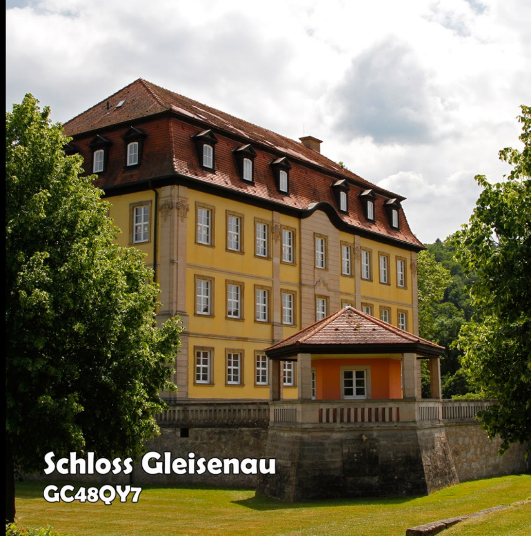
Schloss Gleisenau GC48QY7